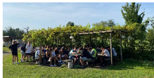
Am Donnerstag wurde nachhaltig – v.a. mit Sonnenenergie - gekocht.