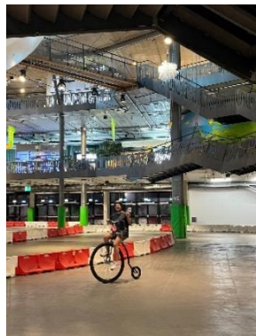
Höhepunkt in der Umweltarena ist jeweils der Parcours, der mit verschiedenen Fahrzeugen zurückgelegt werden kann.